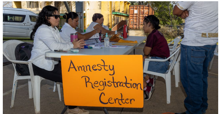
El Centro de Registro del Programa de Amnistía aceptando aplicaciones durante un evento del Centro Móvil para Migrantes, Ciudad de Belmopán, Belice, 2023.