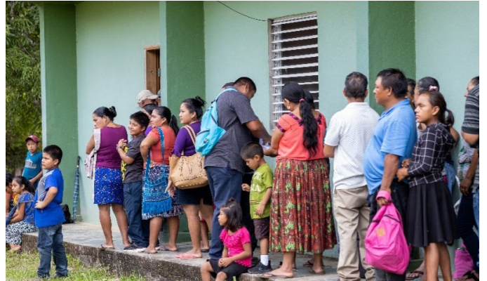
Área de espera para la estación de servicio de Admisión en el Centro Móvil para Migrantes, Blue Creek, Belice, 2022.

Para ofrecer los servicios necesarios para que las personas completaran la solicitud del Programa de Amnistía, la OIM Belice adaptó los Centros Móviles para Migrantes. Con el fin de preparar de forma adecuada a las personas migrantes que calificaban para este proceso y aliviar la alta demanda de servicios que surgieron después del anuncio del Programa de Amnistía. Las adaptaciones se establecieron en coordinación con el Departamento de Nacionalidad y Pasaportes (DNP), socios de las Naciones Unidas, las embajadas y consulados en Belice, representantes de la zona, los presidentes de los consejos locales, y líderes y autoridades locales. Como resultado, la misión estableció doce estaciones de servicio (véase el anexo II) conforme a los criterios de selección del Programa de Amnistía (véase el anexo VIII) para que las personas beneficiarias completaran su solicitud.