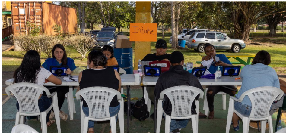
Estación de Admisión en el Centro Móvil para Migrantes, Ciudad de Belmopán, Belice, 2023.

Para alcanzar el número proyectado de personas beneficiarias en cada evento, de 30 a 240 por día aproximadamente, la OIM Belice involucró a personas de varias comunidades cercanas. Durante esta experiencia, la OIM Belice se centró en los seis distritos de Belice. Las áreas seleccionadas por distrito se pueden encontrar en la Tabla A.