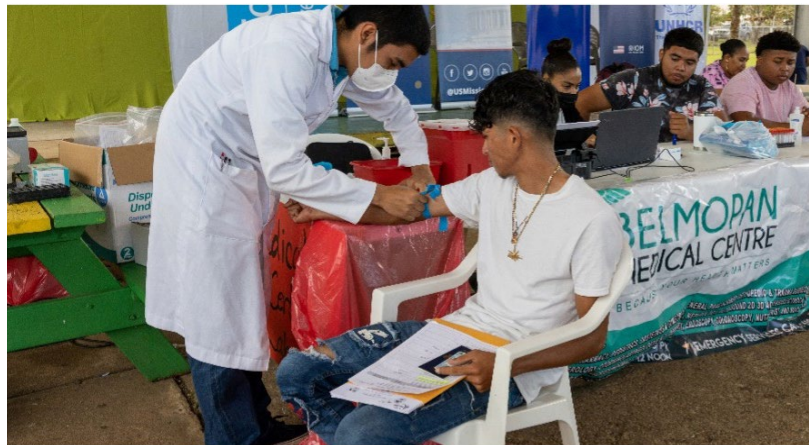
Estación de servicio de Certificado Médico de los Centros Móviles para Migrantes en apoyo al Programa de Amnistía, Ciudad de Belmopán, Belice, 2023.

Además, el equipo elaboró un flujograma con las estaciones de servicio de los Centros Móviles para Migrantes (véase el anexo II) para mejorar la organización y asignar los recursos necesarios para operar cada estación de servicio. El flujograma detallaba una breve descripción de los documentos que la persona beneficiaria necesitaba presentar en cada estación para recibir el servicio, el tiempo estimado que toma finalizar cada proceso, la cantidad de personas, voluntariado necesario para cada estación, los materiales necesarios (por ejemplo, sillas, sellos, entre otros) e instrucciones básicas para las personas que operan la estación. Para organizar la logística de los Centros Móviles para Migrantes, parte del personal de la OIM llegó al lugar un día antes del día del evento para hacer los arreglos necesarios y recibir a las personas beneficiarias. El flujograma de las estaciones de servicio se puede encontrar en el Gráfico B a continuación.