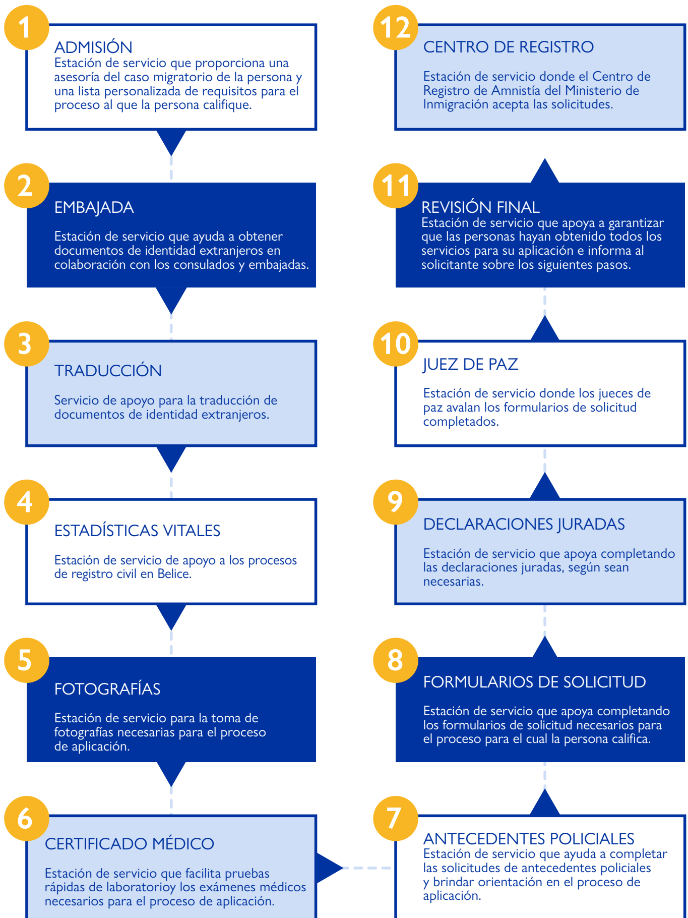
Gráfico B. flujograma de las estaciones de servicio de los Centros Móviles para Migrantes