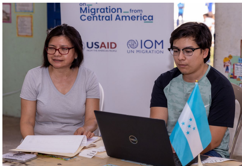
La embajada de Honduras en Belice opera la estación de servicio de Embajadas en el Centro Móvil para Migrantes en apoyo al Programa de Amnistía, Pomona, Belice, 2023.