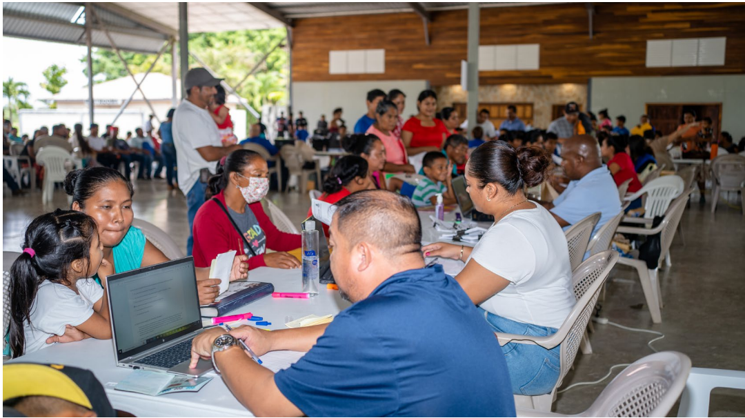
Estación de Admisión y área de espera en el Centro Móvil para Migrantes en apoyo al Programa de Amnistía, Spanish Lookout, Belice, 2022.

pidió su consentimiento informado antes de recopilar la información. Estos datos se utilizaron para crear reportes e infografías que incluyeran variables de género, edad, nacionalidad, ocupación y para qué programa de regularización o proceso de migración calificaron de manera desagregada para garantizar el anonimato (ver Anexo VI). Estos informes luego se compartieron con los donantes, los medios de comunicación y otras contrapartes interesadas, como embajadas, consulados y el Departamento de Inmigración, entre otros; para informar sobre el perfil demográfico básico de los migrantes apoyados en las diferentes pueblos, ciudades y distritos. Los informes de datos también han facilitado generar una asociación estratégica con el DNP para brindar apoyo en las áreas que muestran mayor necesidad. Además, los informes financieros internos incluyen un ejercicio de comparación de los costos presupuestados y los costos reales que, que sirven para informar al equipo de costos imprevistos y la logística a tener en cuenta para los próximos eventos.