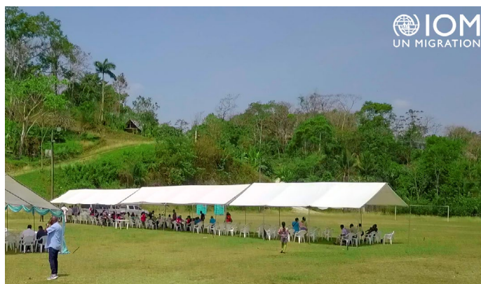
Evento de los Centros Móviles para Migrantes, San Antonio, Belice, 2021.

Además, este objetivo está alineado con el objetivo 10 de los Objetivos de Desarrollo Sostenible: “Reducir la desigualdad en y entre los países”, que en su meta 10.7 indica: “Facilitar la migración y la movilidad ordenadas, seguras, regulares y responsables de las personas, incluso mediante la implementación de políticas migratorias planificadas y bien gestionadas” y el ODS 16: “ Promover sociedades pacíficas e inclusivas para el desarrollo sostenible, facilitar el acceso a la justicia para todos y crear instituciones eficaces, responsables e inclusivas a todos los niveles “ y la meta 16.9: “ De aquí a 2030, proporcionar acceso a una identidad jurídica para todos, en particular mediante el registro de nacimientos” y 16.10: “ Garantizar el acceso público a la información y proteger las libertades fundamentales, de conformidad con las leyes nacionales y los acuerdos internacionales“. Con respecto al Pacto Mundial para una Migración Segura, Ordenada y Regular, esta buena práctica está alineada con el objetivo 3: “Proporcionar información exacta y oportuna en todas las etapas de la migración. “ (acciones c, d y e), el objetivo 4: “ Velar por que todos los migrantes tengan pruebas de su identidad jurídica y documentación adecuada” (acciones d y e) y el objetivo 7: “ Abordar y reducir las vulnerabilidades en la migración “ (acción g).