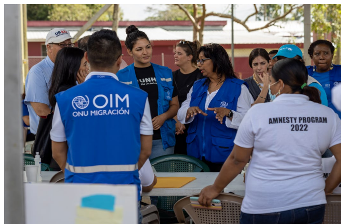
La embajadora de los Estados Unidos de América en Belice, Michelle Kwan, visita el Centro Móvil para Migrantes de Amnistía, Ciudad de Belmopán, Belice, 2023.

del Sistema de Naciones Unidas. Los intercambios entre los líderes locales, el DNP y actores de las OSC facilitaron la planificación del evento teniendo en cuenta las expectativas y las necesidades de cada comunidad.