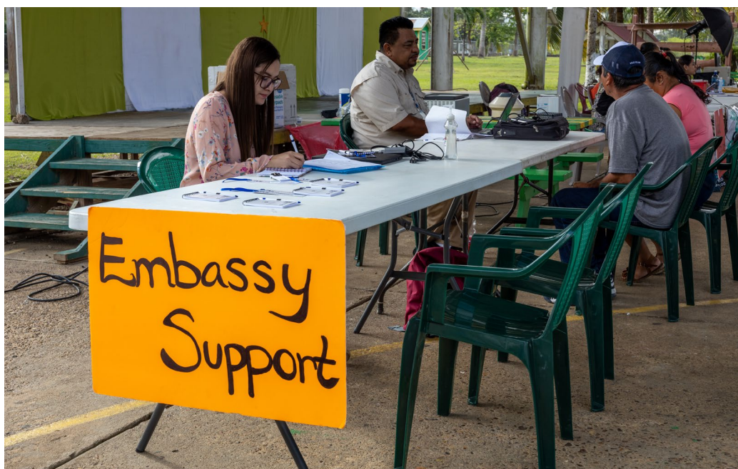
La Embajada de El Salvador en Belice y el Consulado de Guatemala en Belice operan la estación de servicio de Embajadas en el Centro Móvil para Migrantes de Amnistía, Ciudad de Belmopán, Belice, 2023.

En 2022, el Gobierno de Belice, a través del Departamento de Inmigración, implementó un Programa de Amnistía aceptando solicitudes de agosto de 2022 a febrero de 2023 para reducir la vulnerabilidad de la población migrante con estatus irregular en el país y permitir que aquellas personas que cumplieran con los requisitos accedieran al estatus de Residencia Permanente como un camino hacia la ciudadanía. Para facilitar el acceso de la población migrante a la regularización, la OIM adaptó los servicios prestados en los Centros Móviles para Migrantes para atender a las personas que calificaban para al Programa de Amnistía 5 .