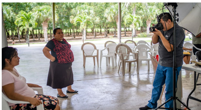
Estación de servicio de Fotografías del Centro Móvil para Migrantes de Amnistía, Spanish Lookout, Belice, 2022.