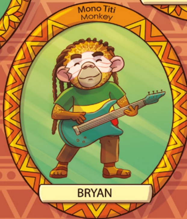
Mono Titi Monkey