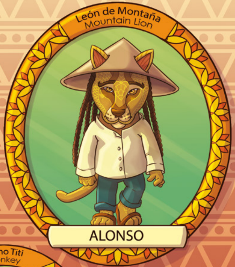
León de Montaña Mountain Lion