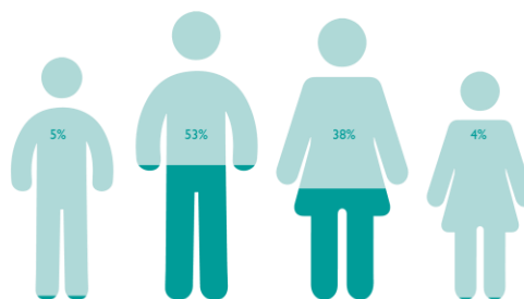
Figura 2. Proporción de personas encuestadas, por sexo y edad

La mayoría eran personas adultas (91%), pero los equipos de monitoreo de RVA también encuestaron a niñas, niños y adolescentes (NNA) para comprender de mejor manera sus experiencias como personas retornadas. 4 La Figura 2 muestra la proporción de las personas encuestadas por sexo y edad.