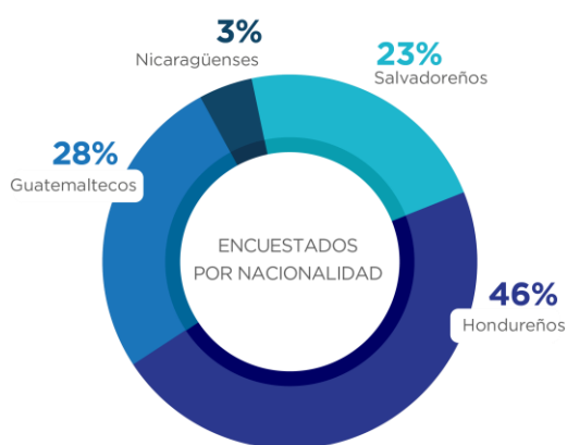
Figura 1. Nacionalidad de las personas encuestadas

De junio a julio de 2021, los equipos de monitoreo de RVA encuestaron a 67 personas beneficiarias que retornaron a sus países de origen entre el 5 de mayo y el 27 de julio de 2021 (representando al 18% de las y los beneficiarios durante este período), que dieron su consentimiento previo a su partida, para participar en la encuesta. El 79% de las personas encuestadas fueron asistidos por el RVA en México, el 10% por el RVA en Guatemala, el 8% por el RVA en Belice y el 3% restante por el RVA en El Salvador.