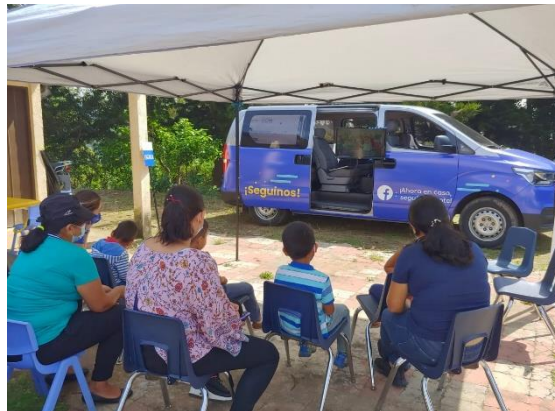
Foto 6. Realizando prevención de la migración irregular a través de materiales audiovisuales desarrollados por la OIM. Comasagua, La Libertad