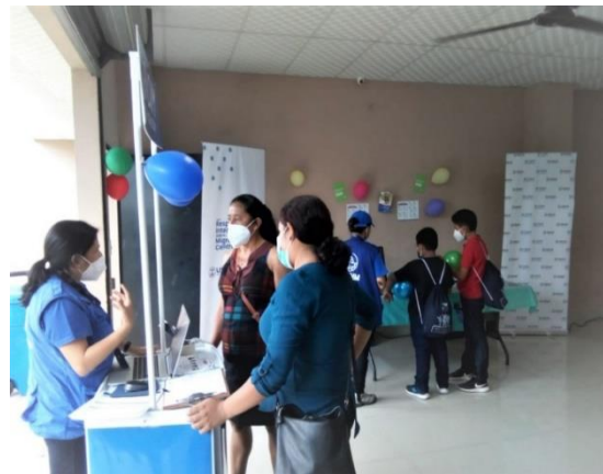
Foto 2. Estación informativa a personas migrantes retornadas. Tejutla, Chalatenango.