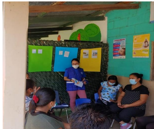
Foto 4. Estación de salud mental y apoyo psicosocial.