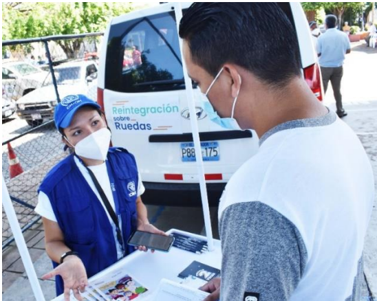
Foto 1. Estación informativa a personas migrantes retornadas. Guazapa, San Salvador