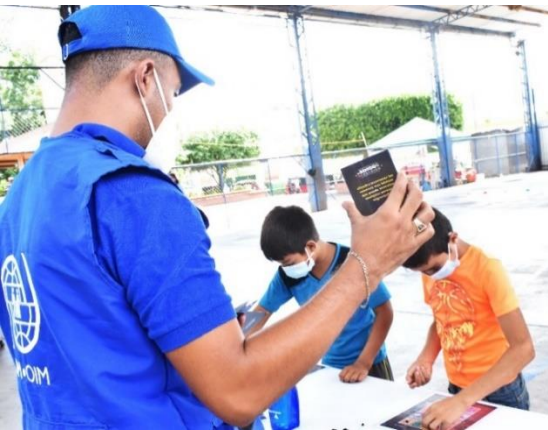
Foto 3. Estación lúdica, bingo de la migración, San Salvador, Guazapa.