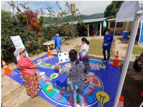
Foto 5. Estación lúdica, enseñando sobre prevención de la migración irregular y reintegración. Comasagua, La Libertad.